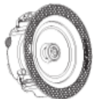
GC5 / GC6 GC5T / GC6T