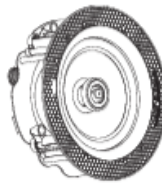
GC8 I GC8T I