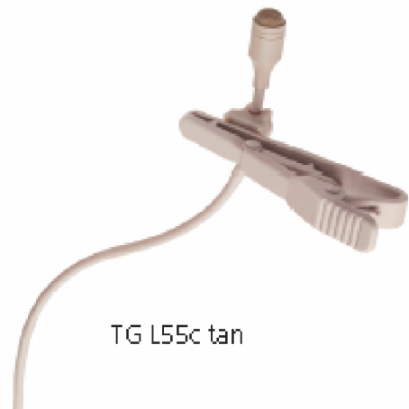
TG L55c tan