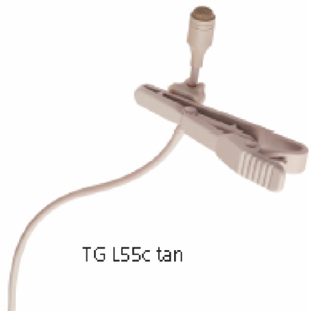
TG L55c tan